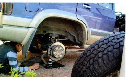
Zig tausend Kilometer haben die Brüder in diversen Mietwagen zurückgelegt. Dabei lief nicht immer alles glatt, wie hier in Australien.